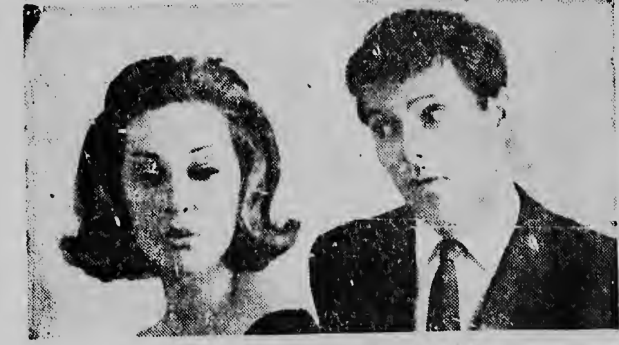
Probeer nu eens BRYLCREEM

BO TA BUSCA UN REGALO ADECUADO Y UTIL? Nos a caba di ricibi un lote precioso di POPCHI den varios tamanjo. Tambe otro articuls manera FLUZ, CAMISA, CARSON, BISTIR, SAPATU, TELA PA CORTINA y CANTIDAD MAS, pasa mas pronto posibel na PEOPLE STORE e cas di pueblo y semper pa e pueblo!